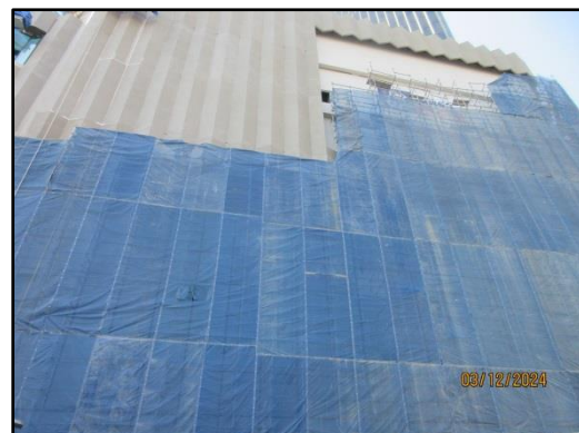
รูปที่ 1-2 สภาพปัจจุบันของพื้นที่โครงการ