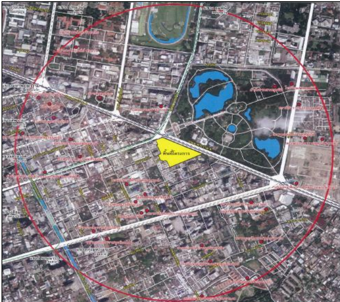
รูปที่ 1-1 แผนที่แสดงที่ตั้งโครงการ

นอกจากนี้ โครงการได้จัดให้มีมาตรการการจอดรถยนต์ติดก๊าซในชั้นใต้ดิน โดยกำหนดให้จอดในบริเวณที่อนุญาตให้รถยนต์ติดก๊าซจอดได้เท่านั้น ซึ่งอยู่บริเวณชั้นใต้ดินที่ 4 โดยบริเวณดังกล่าวโครงการได้ติดตั้ง Gas Detector และตำแหน่งเสาบริเวณดังกล่าวมีการหุ้มเหล็กหนา 10 มม. โดยรอบตลอดความสูงของชั้น นอกจากนี้ โครงการได้กำหนดให้รถยนต์ติดก๊าซสามารถจอดบริเวณชั้นที่ 1 ที่มีอยู่บริเวณด้านหน้าภายนอกอาคาร