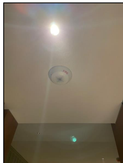
รูปที่ 1-2 สภาพปัจจุบันของพื้นที่โครงการ