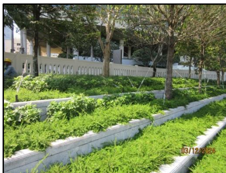
รูปที่ 1-2 สภาพปัจจุบันของพื้นที่โครงการ